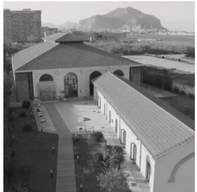
DAY 2 | Ecomuseo Mare Memoria Viva