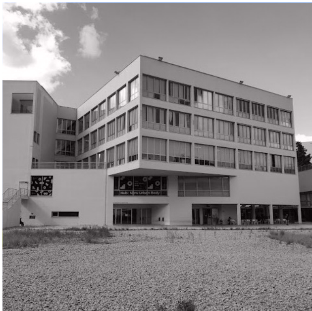
DAY 1 | Dipartimento di Architettura, UNIPA